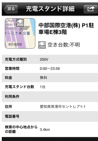
※画面イメージはiPhone®のものです。