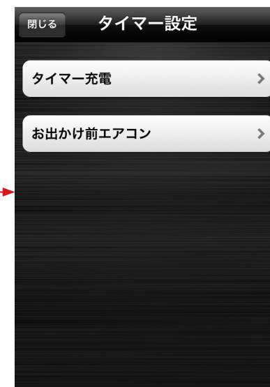
※画面イメージはiPhone®のものです。