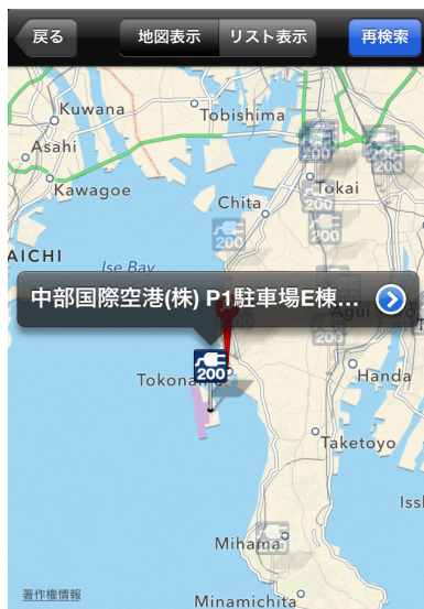
※画面イメージはiPhone®のものです。