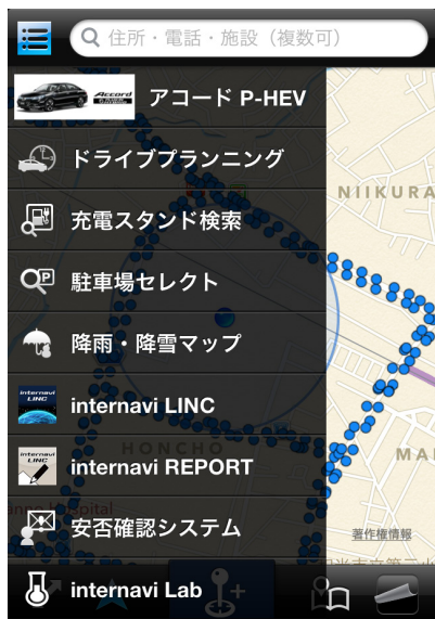
※画面イメージはiPhone®のものです。

任意の地点付近の充電スタンドを検索し、地図に表示します。検索条件は以下のような条件で設定することができます。