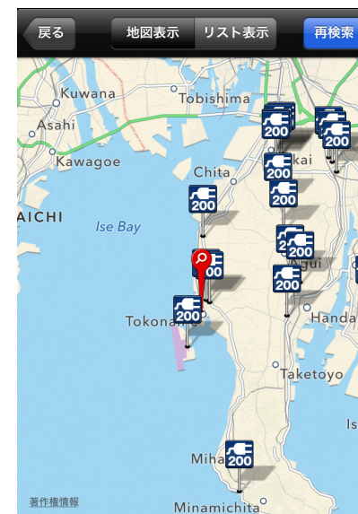
※画面イメージはiPhone®のものです。

表示されている地図の拡大したい箇所をダブルタップすると拡大することができます。ピンチして拡大／縮小することもできます。