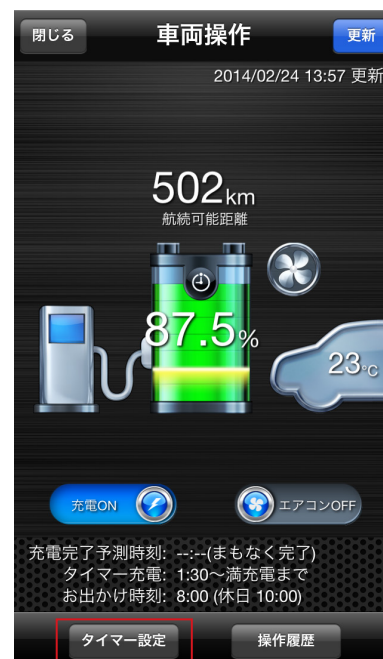
※画面イメージはiPhone®のものです。