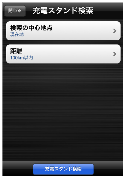
※画面イメージはiPhone®のものです。