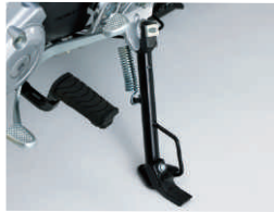
荷物積載時も安定感のある 停車が可能な強化サイドスタンド (スーパーカブ50プロ/110プロ共通装備)

*1 燃料消費率(60km/h定地燃費値(1名乗車時))*2 平成32年(令和2年)排出ガス規制。*3 燃料消費率(30km/h定地燃費値(1名乗車時)) ※燃料消費率は、定められた試験条件のもとでの値です。お客様の使用環境(気象、渋滞等)や運転方法、車両状態(装備、仕様)や整備状態などの諸条件により異なります。定地燃費値は、車速一定で走行した実測にもとづいた燃料消費率です。