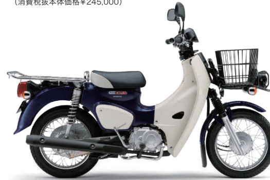
車体色:セシエルナイトブルー

C50BN2@J メーカー希望小売価格 ¥269,500 (消費税抜本体価格¥245,000)