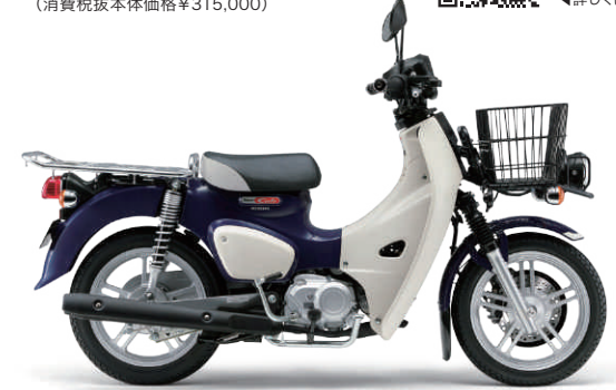
車体色:セシエルナイトブルー

C110BN@J メーカー希望小売価格 ¥346,500 (消費税抜本体価格¥315,000)