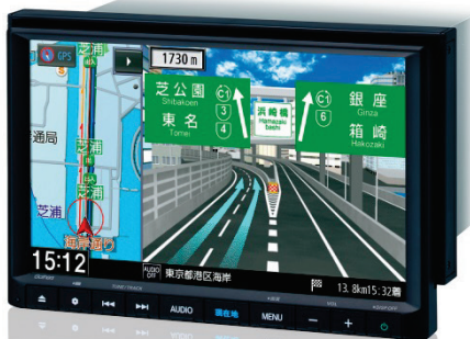
VXM-195VFEi 8 インチ ベーシック インターナビ

※1 ステップ ワゴン専用の VXU-197SWi(10 インチ プレミアム インターナビ)は 2019 年 1 月下旬発売予定