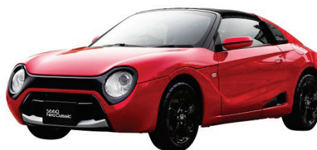
「S660 Neo Classic」 S660 中古車ベース架装車両