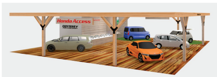
ホンダアクセスブースイメージ

（TASA〈TOKYO AUTO SALON ASSOCIATION〉）後援：経済産業省（予定）、千葉県、千葉市、一般社団法人 日本自動車用品・部品アフターマーケット振興会（NAPAC）、一般社団法人 日本自動車工業会（JAMA）、一般社団法人 日本自動車連盟（JAF）[順不同]