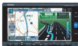
ベーシック インターナビ VXM-174VFi