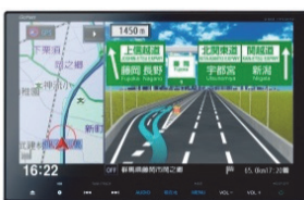
9インチプレミアムインターナビ VXM-175VFi