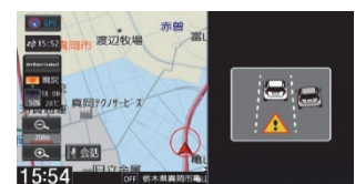
リアカメラ de あんしんプラス 後方死角サポート画面