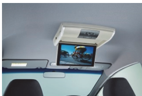
11 インチリア席モニター