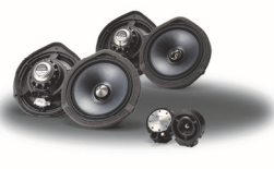
ハイグレードスピーカーシステム