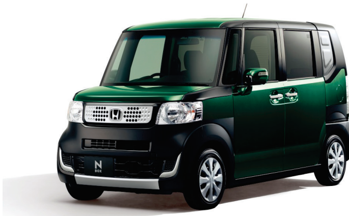
N-BOX G・L パッケージ ELEMENT Style Package 装着イメージ

ELEMENT Style Packageは、2003年に発売されたHonda「エレメント」のネーミングに込められた「自分の生き方を大切にしたい人にとって欠かせない存在でありたい」という想いを受け継ぎ、2014年1月に開催された東京オートサロン2014のHondaブースに「N-BOX+ ELEMENT Concept」として出展。このコンセプトモデルの好評を受け、同車のイメージを再現するパッケージアイテムとして開発しました。前後バンパー、フロントグリルに加え、各部ガーニッシュをセットとした「エクステリアキット」と、前後フェンダー、サイドシルガーニッシュ、テールゲート、ルーフの形状に合わせてカット済みの「フィルムキット」を組み合わせて装着することで、車両本体とは異なる独特、かつユニークなスタイリングを実現しました。マットブラックを基調としながら、シルバーを組み合わせたカラーリングを追加することで、N-BOXシリーズのスタイリングに力強さとアクティブさを強調しています。