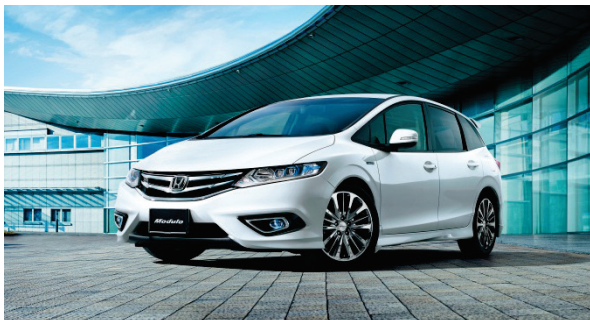
「ジェイド」HYBRID 純正アクセサリ装着イメージ

また、インテリアでは「LEDスピーカーリング&ドアポケットイルミネーション」や「センターコンソールイルミネーション」など光の演出によるアイテムでスタイリッシュな上質さと先進感を強調。さらに3列目をラゲッジとして使用する際に車内の汚れを防ぐ「ラゲッジトレイ」「ラゲッジマット」、そしてラゲッジスペースを簡易に隠せる「ラゲッジカバー」など、日常での使い勝手を向上させるアイテムを設定し、「ジェイド」の魅力をさらに高めています。