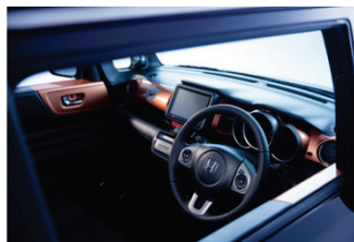
「N-BOX SLASH」 Blusy Sounds インテリアイメージ