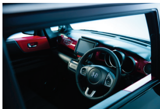
「N-BOX SLASH」 Hot Sounds Factory インテリアイメージ