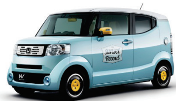
「N-BOX SLASH」 Sunset Records エクステリアイメージ