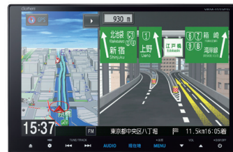
サウンドマッピングシステム対応 8インチ プレミアムインターナビ VRM-155VFEi

お客様からの商品についてのお問合せ先：「株式会社ホンダアクセス お客様相談室 0120-663521」 受付時間：9～12時、13～17時（土日・祝日・弊社指定定休日は除く）