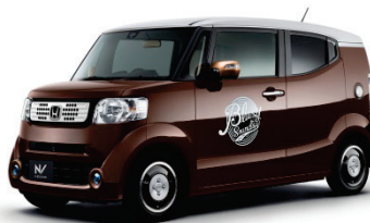
「N-BOX SLASH」 Blusy Sounds エクステリアイメージ