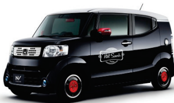
「N-BOX SLASH」 Hot Sounds Factory エクステリアイメージ

また機能用品として、車外からのノイズ低減・オーディオの音響表現向上を図る「ピュアサウンドブース」を設定。「N-BOX SLASH」専用にキット化した吸音材や制振材を内装施工することで、心地よい室内空間を実現します。Gathers ナビゲーションは、「N-BOX SLASH」の特長の一つ『サウンドマッピングシステム』に対応する2タイプを新たに開発。高音質や臨場感にこだわったセッティングで、音響面からも、“ミュージックボックス”としての「N-BOX SLASH」の魅力を実際立たせます。