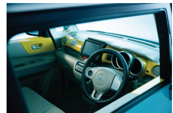
「N-BOX SLASH」 Sunset Records インテリアイメージ