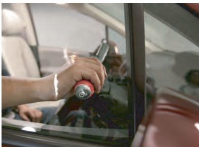
本体底部の破砕ピンでドアガラスを破砕