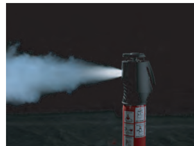
フロントグリルからエンジンルームへ炭酸ガスを噴射し消火

お客様からのお問合せ先は、「株式会社ホンダアクセス お客様相談室 0120-663521」へお願い致します。 受付時間:9時~12時、13時~17時(土日祝祭日を除く)