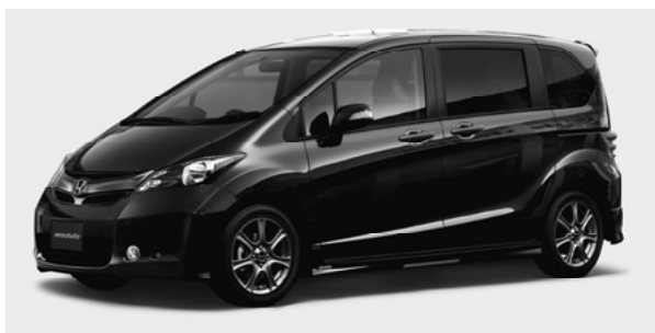
「フリード」ディーラーオプション装着車

※1 SSD:ソリッドステートドライブ……フラッシュメモリーとコントローラーが一体になり、データの書き込みがスピーディに行える次世代の記憶媒体