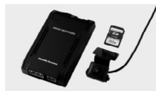
ドライブレコーダー