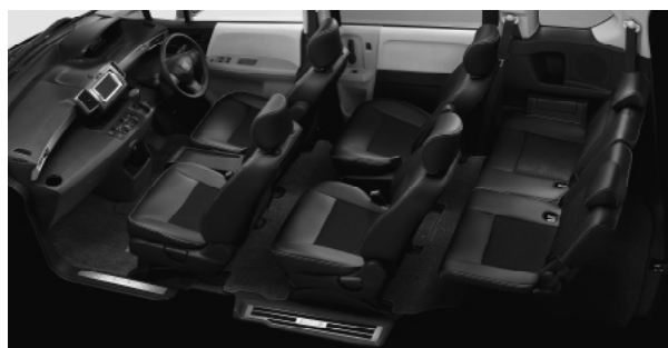
インテリアコーディネート例

ラゲッジルームネット ¥10,500(消費税抜き¥10,000) トレイ ¥8,400(消費税抜き¥8,000)