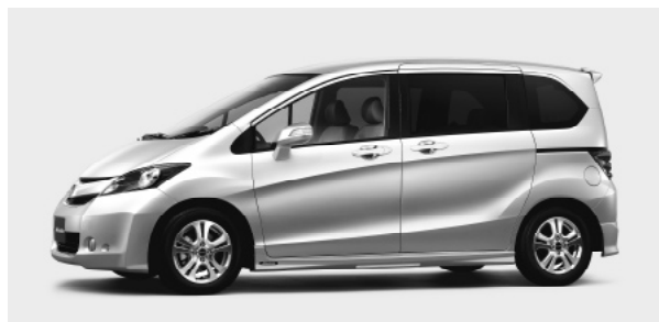
ディーラーオプション装着者 サイドスタイリング