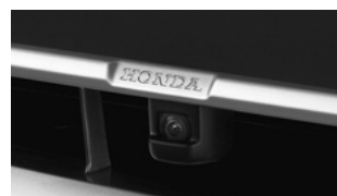
フロントカメラシステム