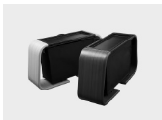
センターコンソール