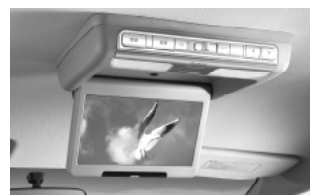
リア席モニター(ルーフ取付タイプ)