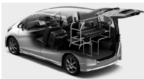
サイドパイブラックシステム装着例