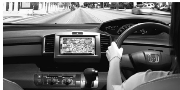
「Gathers」SSDインターナビモデル VXS-092CVi(インターナビ対応機種)フリード装着例

お客様からのお問い合わせは、「株式会社ホンダアクセス お客様相談室0120-663521」へお願い致します。 受付時間:9時~12時、13時~17時(土日祝祭日を除く)