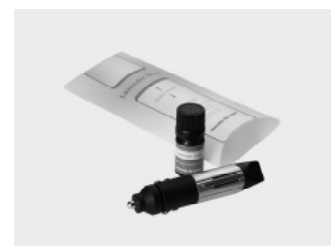
アロマモーメント