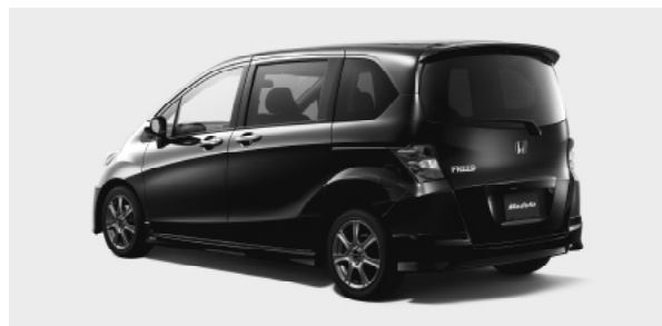
ディーラーオプション装着者 リアスタイリング