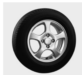
アルミホイールMS-010(16インチ) アルミホイールMS-012(15インチ) アルミホイールMS-005(14インチ) アルミホイールMS-003(14インチ)

「商品情報サイト」フリードアクセサリーホームページ http://www.honda.co.jp/ACCESS/freed/