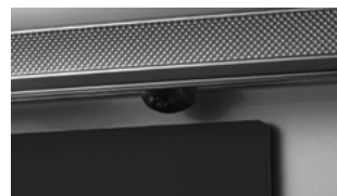
リアカメラシステム