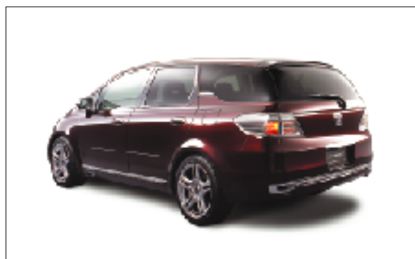
リアスタイリング