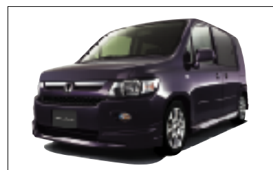
「モビリオ スパイク」モデュール装着車