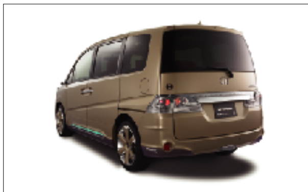
リアスタイリング