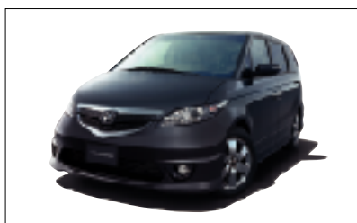
「エリシオン」モデュール装着車