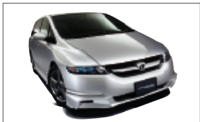
「オデッセイ」モデュール装着車

お客様からのお問い合わせは、「株式会社ホンダアクセス お客様相談室 0120-663521」へお願い致します。