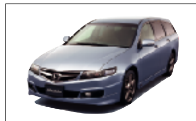
「アコードワゴン」モデュール装着車