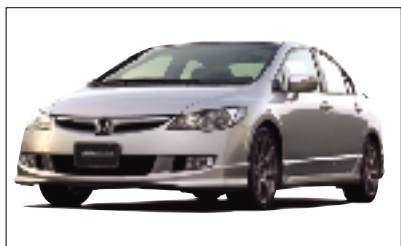
「シビック」モデュール装着車

昨年9月に発表したシビック・モデュールをはじめ、アコード、アコードワゴン、ステップワゴン、エリシオン、モビリオ スパイク、オデッセイ等、モデュール装着車を会場に展示。世界のトップレベルをいくHonda車の魅力を更に高めるホンダアクセスのハイクオリティなアクセサリーを紹介する。