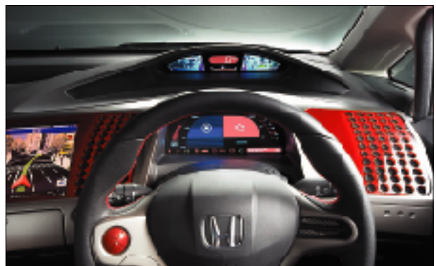
ドアミラーカメラ対応ツインメーター