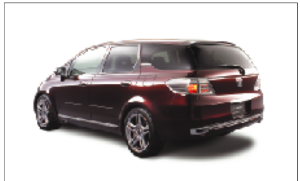
リアスタイリング