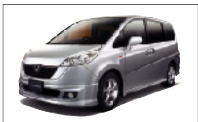
「ステップワゴン」モデュール装着車