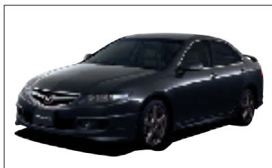
「アコード」モデュール装着車