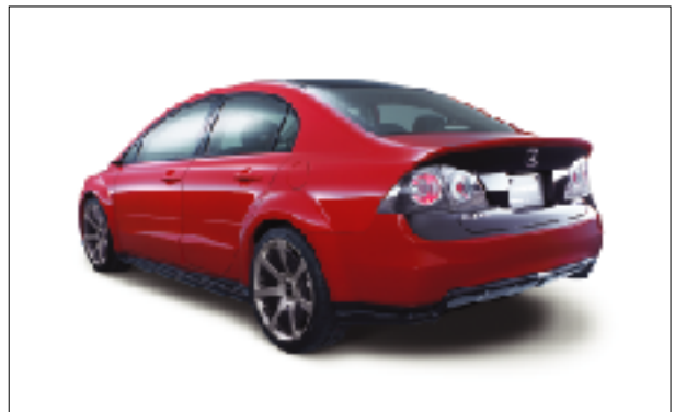
リアスタイリング