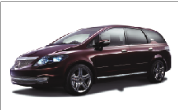
フロントスタイリング

さらに、室内も上質な大人の車提案を基本に、革巻きステアリングホイールやセレクト・ノブ、本革シート、フローリング張りのラゲッジルーム等、従来にないインテリア感覚を盛り込み、木目加飾や高輝度インテリアパネル、ハイクオリティスピーカーハウジング等、高級感の演出に徹底的に配慮。見るもの、触れるものすべてに上質を感じるプレミアムコンパクトの提案である。