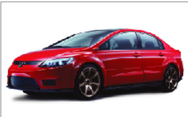
フロントスタイリング

さらに、NAVI、オーディオ、エアコンの情報を一括表示するインフォメーションディスプレイやタッチパッドコントロール、外部機器接続ポケット、ドアミラーカメラ等の先進装備も充実。これからの時代に先駆けたドライバビリティ向上の提案である。