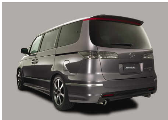
リアスタイリング