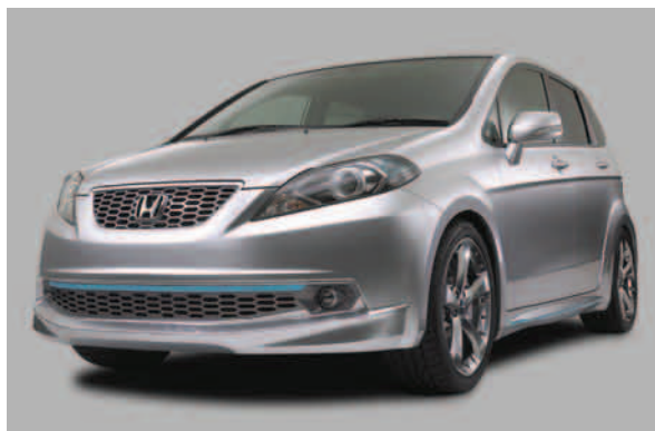
フロントスタイリング