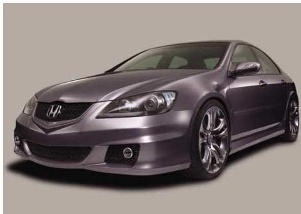
フロントスタイリング