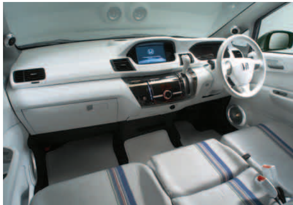
インテリアパネル