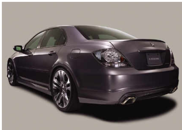
リアスタイリング