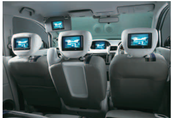
助手席バイザーモニター/ヘッドレストリアモニター