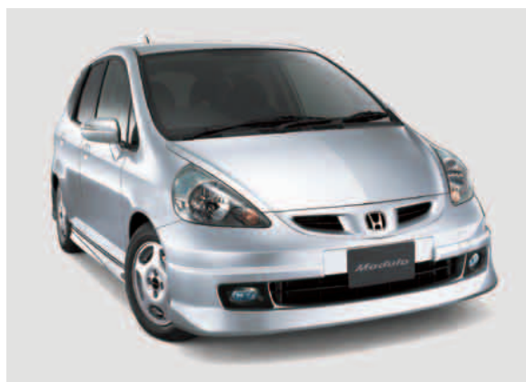
「フィット」モデューロ装着車

タイプYYとは…タイプZZの後、追加発売されるロアスカートのタイプ名。オデッセイのロアスカートタイプYYは2005年2月発売予定。 ※一部、出展車両とボディカラーが異なります。