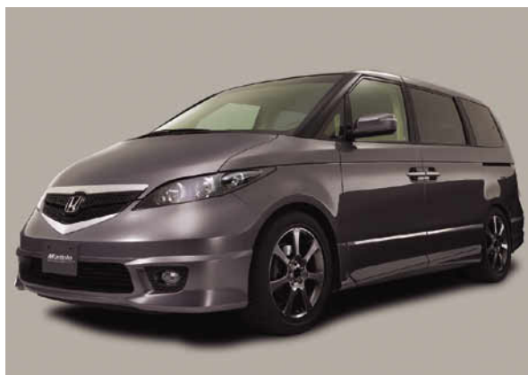
フロントスタイリング

レジェンド・モデューロ・コンセプトと印象を合わせたボンネットグリル、ダイナミックな面構成とシャープなエッジを組み合わせたフロント回りからエッジと弓形状を特徴としたロアスカートサイド(サイドシル一体タイプ)とフロントからリアへ流れるサテン塗装モール、さらに、ボディカラーに合わせた専用カラーのアルミホイール、3サークルを強調しスポーティ性を高めたヘッドライト、クリアレンズを採用し精悍さを演出するリアコンビランプなど、すべてがミニバントップグレードにふさわしいプレミアム感を演出するカスタマイズ提案となっている。