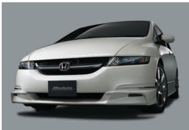
「オデッセイ」モデューロ装着車(タイプYY)

昨年末に発表したモデューロ新ロアスカート装着したオデッセイと、エディックス、フィットのモデューロ装着車を会場展示し、Honda車とホンダアクセスのデザインとクオリティを融合させた「Honda純正カスタマイズ」の世界を紹介する。