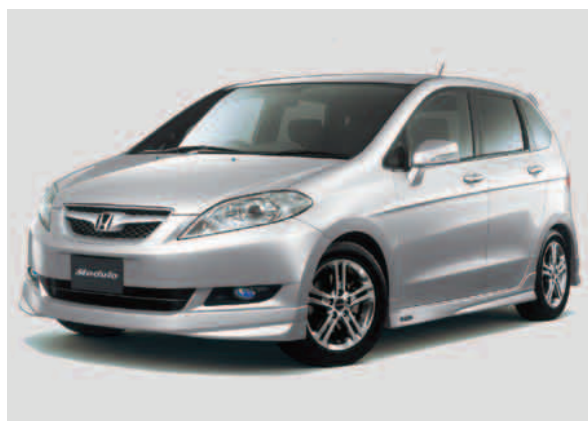
「エディックス」モデューロ装着車