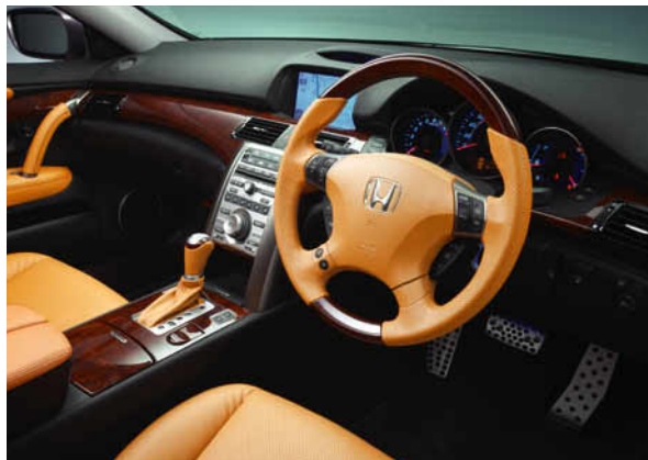
インテリアパネル