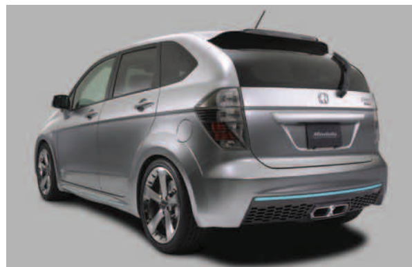
リアスタイリング