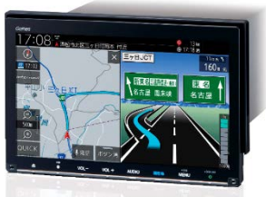
9インチ プレミアム インターナビ VXM-217-VFNi

※4 車種専用チューニングは「tuned by DIATONE SOUND」機能搭載のモデル VXM-217VFNi/VXM-217VFEi/VXU-217DYi/VXU-217SWi/VXU-217NBi および「音の匠」機能搭載のモデル VXU-215FTi で利用可能