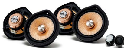
ハイグレードスピーカー (6スピーカーセット)