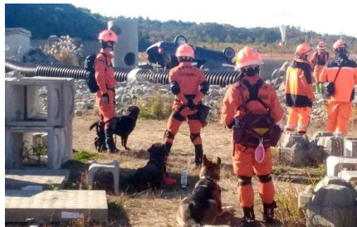
国内救助犬&消防&スイス REDOG による国際連携訓練

N-VAN の車室の広さを活かし、中型犬用のクレートと活動に必要なさまざまな装備・用具を積載しやすいよう収納機能を追加。必要なときには車中泊もできるようになっています。ルーフには断熱塗装を施し、クォーターウィンドウには換気用ファンを装備するなど、暑い季節での活動にも対応しました。テールゲートドアにはラダーを設置し、ルーフキャリアへの荷物の積載を容易にしています。