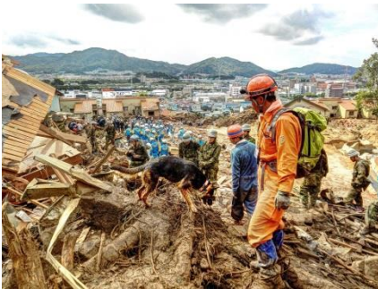
救助犬による行方不明者捜索活動

災害救助犬の仕事は、災害時や遭難の際に動けなくなった人を、その人の呼気などをたよりに優れた嗅覚を使って見つけ出し、吠えるなどして居場所を知らせるというものです。審査を経て救助犬としての適正が認められると、指導手（ハンドラー）とともに訓練と審査を重ね、いざというときは関係各機関と連携しながらハンドラーと救助隊と一緒に行方不明者の捜索に従事します。多くの場合、救助犬の飼い主がハンドラーであり、すべての活動はボランティアとして自己負担で行われています。訓練はもちろん災害時も飼い主のクルマで出動します。今回、これらの活動を行っている NPO 法人災害救助犬ネットワークにご協力いただき、災害救助犬ボランティア仕様のコンセプトモデルとして制作しました。