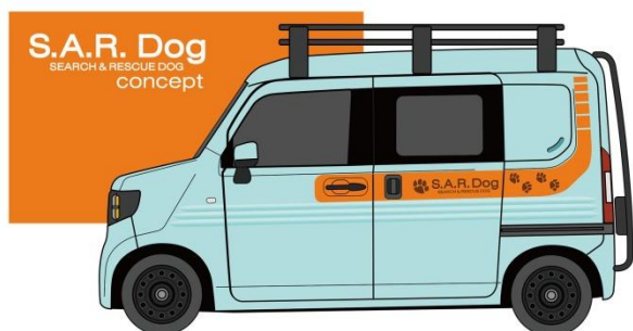
「S.A.R. Dog Concept」イメージ

※4 最大バリケネル 300 サイズ（約 W57×D81×H62cm）2 個、200 サイズ（約 W52×D71×H53.5cm）1 個を積載可能